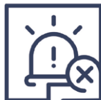
2.4 Qualitätsmangel Alarmfunktion fehlerhaft