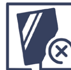
2.6 Qualitätsmangel Beschichtung fehlerhaft