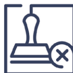
3.5 Falschfertigung Falsche / fehlerhafte Stempelung oder Mar- kierung