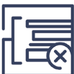
3.1 Falschfertigung Falscher Aufbau