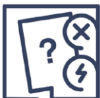
4.1 Reklamationsgrund nicht aufgeführt