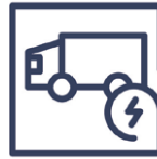
1.5 Beschädigung Transportschaden / Transportbeschädigung