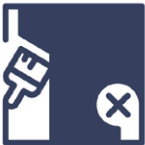
2.8 Qualitätsmangel Siebdruck / Digital- druck fehlerhaft