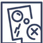
2.1 Qualitätsmangel Glasfehler