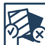
3.6 Falschfertigung Falsche Glasart