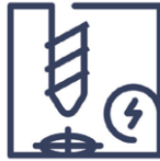
1.4 Beschädigung Bohrungsbeschädigung