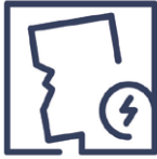
1.2 Beschädigung Kantenbeschädigung