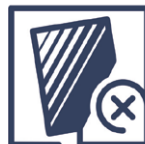
2.5 Qualitätsmangel Glaskorrosion