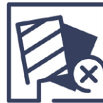
2.11 Qualitätsmangel Farbabweichung