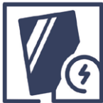
1.8 Beschädigung Schichtbeschädigung