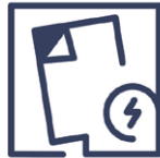
1.9 Beschädigung Folienbeschädigung