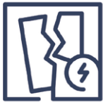
1.7 Beschädigung Glasbruch