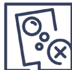
2.3 Qualitätsmangel Blasen