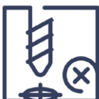
3.2 Falschfertigung Falsche / fehlerhafte Bohrung