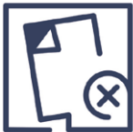
2.7 Qualitätsmangel Folierung fehlerhaft