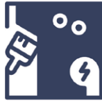
1.3 Beschädigung Siebdruck- / Digital- druckbeschädigung