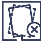
2.10 Qualitätsmangel Scheibenversatz