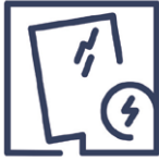
1.1 Beschädigung Kratzer / Schaber