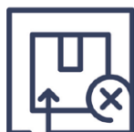
3.3 Falschfertigung Falsche Ware geliefert