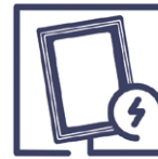
1.6 Beschädigung Modulrahmenbeschä- digung