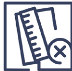
2.9 Qualitätsmangel Maßabweichung