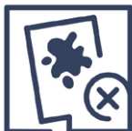
2.2 Qualitätsmangel Innenschmutz im VSG / im Scheibenzwischen- raum ISO