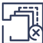
3.4 Falschfertigung Fehlmenge